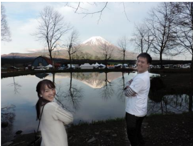
←2日目の最後には、キレイな富士山が顔を出しました！ 水面に映る見事な逆さ富士！

(Twitter / https://twitter.com/kmixshizuoka Facebook / https://www.facebook.com/kmixshizuoka )