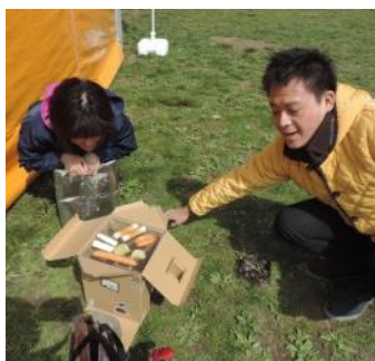
雨でも楽しめる! 燻製をご紹介します