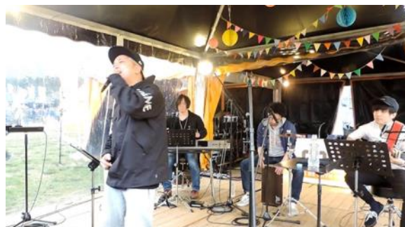
LIVEゲストに175R&The Campersをお迎えしました!